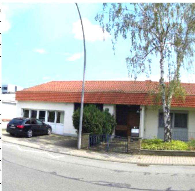
Die Firmenzentrale der Schweickert

Entscheidung projekt einzusetzen war, neben den administrativen und kaufmännischen Merkmalen, die Basis der Datenhaltung.