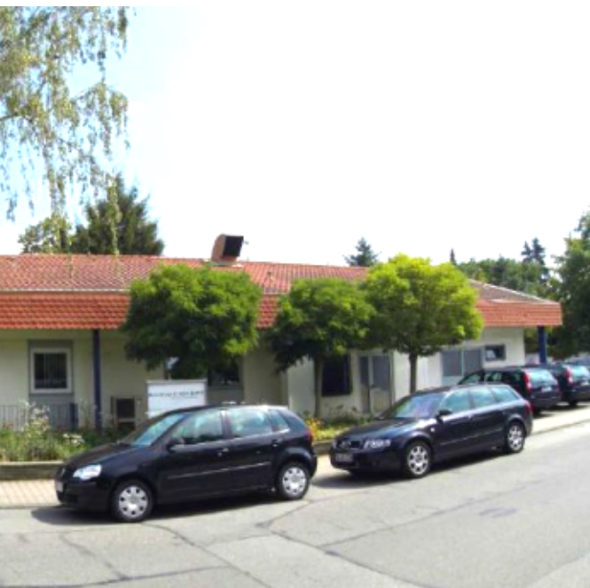
rt Netzwerktechnik GmbH in Walldorf

greifen von den 75 Mitarbeitern bei der Netzwerktechnik 20-25 und bei der Elektrotechnik 18 Personen auf die projekt Software zu.